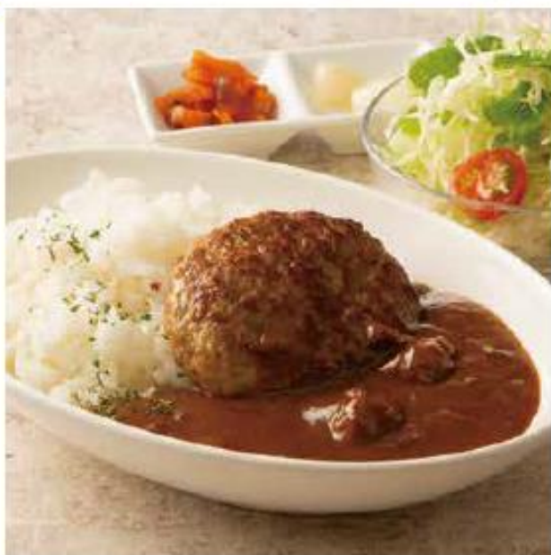
ハンバーグカレーセット