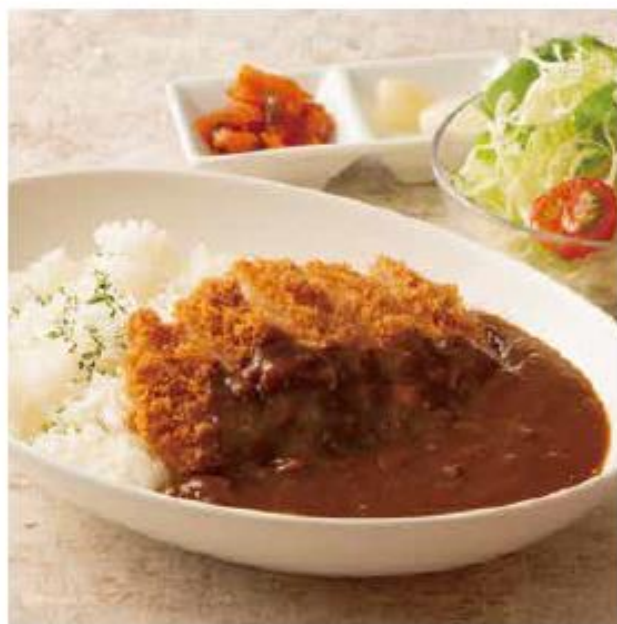
かつカレーセット