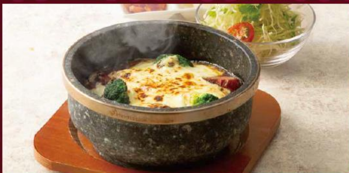
石焼カレーセット サラダ・福神漬け&らっきょう付 1,870円